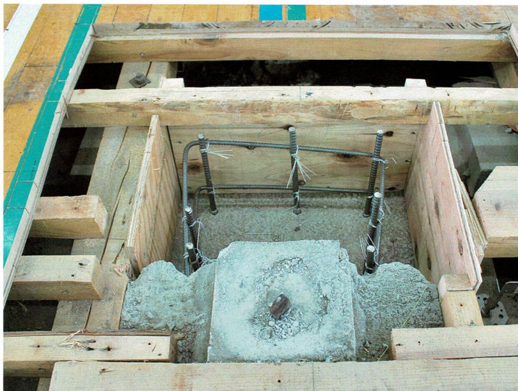
型枠設置完了後、開口部の閉鎖作業へ