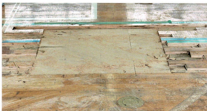
床材を貼るために周囲の床材を割り付ける