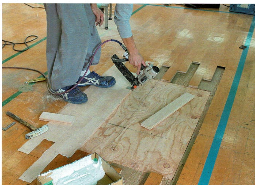
熟練の床材貼り込み作業。サネ合わせもピッタリ