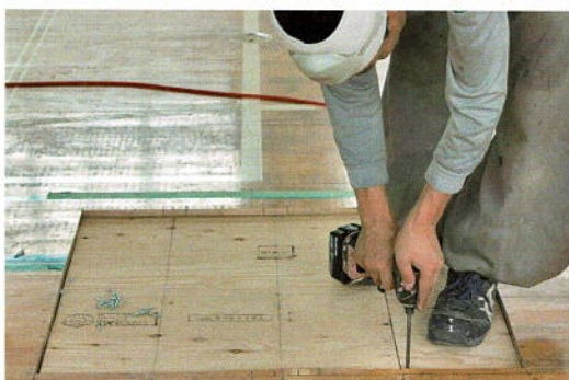
コンパネをしっかり留める